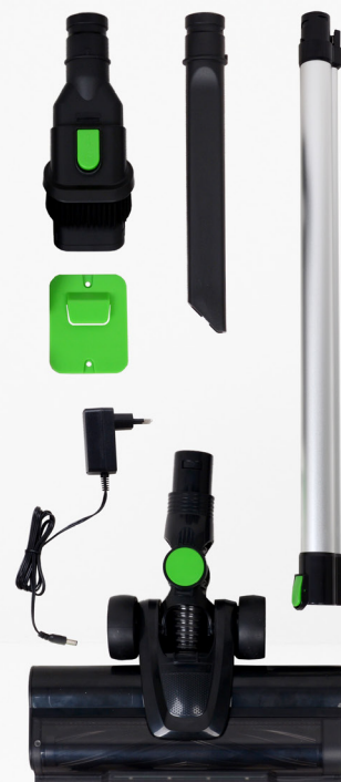
Accessori inclusi Accessories included